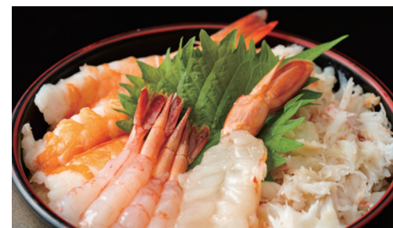
えびかにちらし 1,580円 (税込)