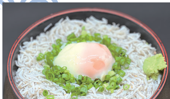
温玉釜揚げ しらす丼 980円 (税込)