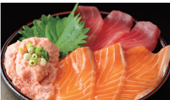
まぐろとサーモン ネギトロ合盛り丼 1,080円 (税込)