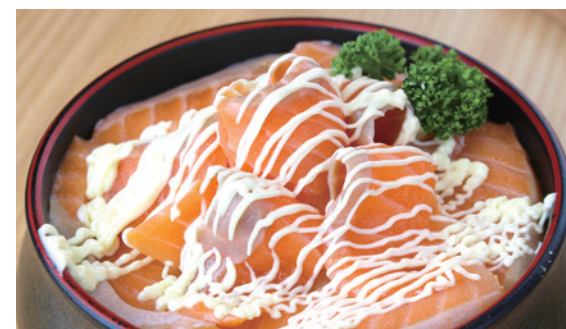
サーモンオニオン丼 1,280円 (税込)