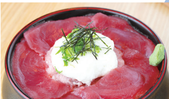
まぐろ山かけ丼 1,280円 (税込)