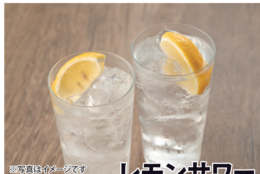
レモンサワー 220円 (税込)