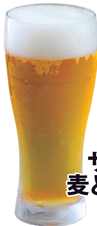
サッポロ 麦とホップ 220円 (税込)