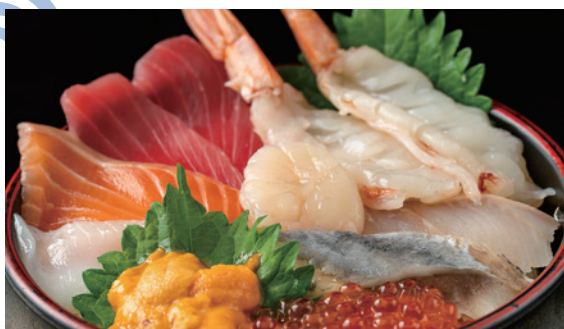
北海道直送丼極 1,980円 (税込)