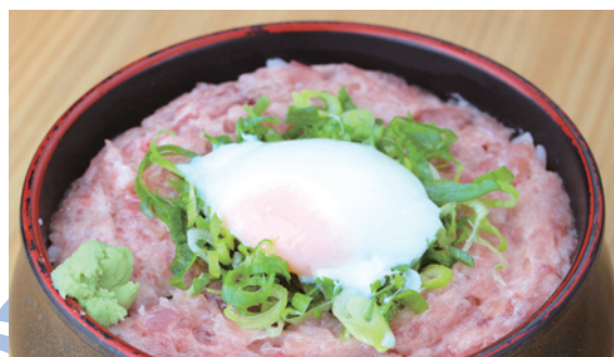
温玉 ネギトロ丼 1,080円 (税込) ミニ 680円 (税込)