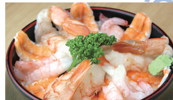
えびちらし 1,430円 (税込)