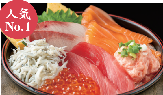
海鮮丼 1,480円 (税込)