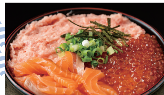
三色丼 (いくら・ネギトロ・サーモン) 1,480円 (税込)