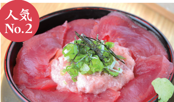
鉄火丼 1,180円 (税込) ミニ 630円 (税込)