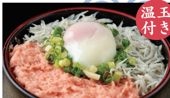
ネギトロしらす 二色丼 1,080円 (税込)