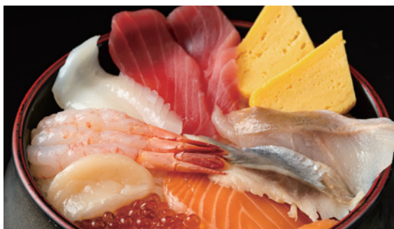
北海道直送丼 1,430円 (税込)