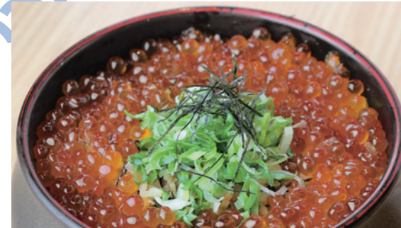
いくら丼 1,800円 (税込) ミニ 950円 (税込)