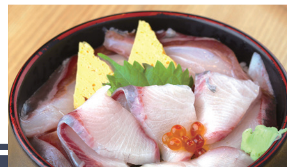
ぶり丼 1,280円 (税込) ミニ 700円 (税込)