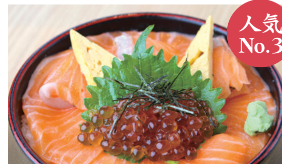
サーモン 親子丼 1,580円 (税込) ミニ 850円 (税込)