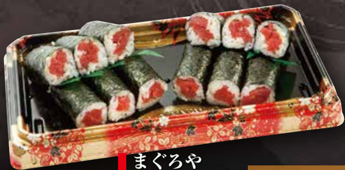
まぐろや 鉄火巻き