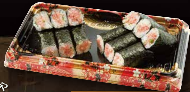
まぐろや ねぎとろ巻き