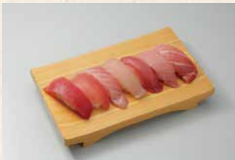
究極まぐろ七貫握り