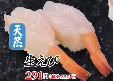
天然 生えび 291円(税込320円)