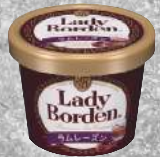
レディーボーデンカップアイス バニラ・チョコレート・コーヒー・ラムレーズン 291円(税込320円)