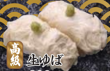
高級 生ゆば 200円(税込220円)