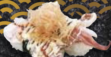
げそマヨ握り 237円(税込260円)