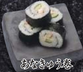
あなきゅう巻 437円(税込480円)