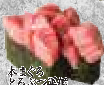
本まぐろ とろぶつ軍艦 619円(税込680円)