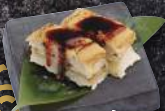
穴子押し寿司 346円(税込380円)