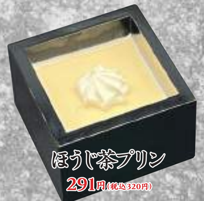
ほうおう茶プリン 291円(税込320円)