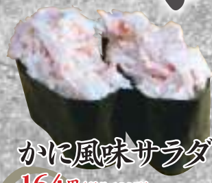
かに風味サラダ 164円(税込180円)