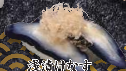
浅漬けなす 164円(税込180円)