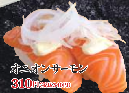
オニオンサーモン 310円(税込340円)