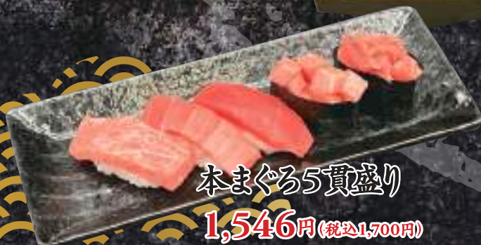
本まぐろ5貫盛り 1,546円(税込1,700円)