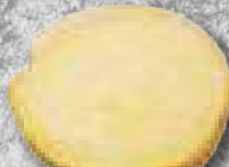
オレンジシャーベット 328円(税込360円)