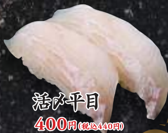
活け平目 400円(税込440円)