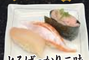
とろばっかり三昧