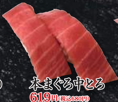
本まぐろ中とろ 619円(税込680円)