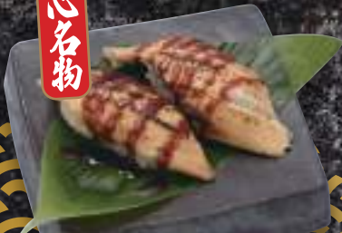
活〆釜煮天然穴子 437円(税込480円)