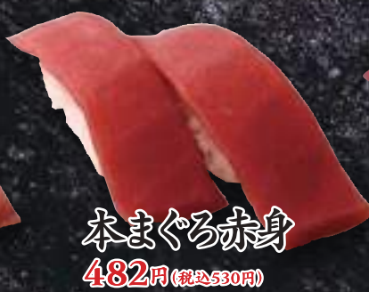
本まぐろ赤身 482円(税込530円)