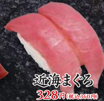
近海まぐろ 328円(税込360円)