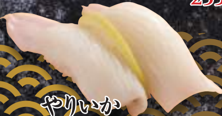
やりいか 255円(税込280円)