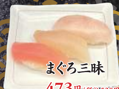
まぐろ三味 473円(税込520円)