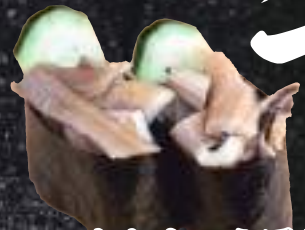
あなきゅう軍艦 346円(税込380円)