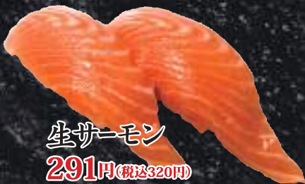
生サーモン 291円(税込320円)