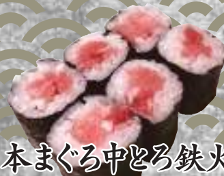
本まぐろ中とろ鉄火 619円(税込680円)