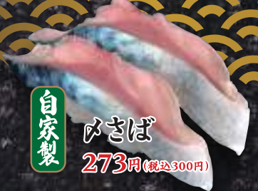
自家製 みさば 273円(税込300円)