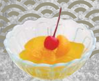
オレンジゼリー 150円(税込165円)