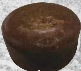
フォンダンショコラ 346円(税込380円)