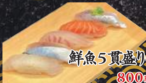
鮮魚5貫盛り(日替わり)