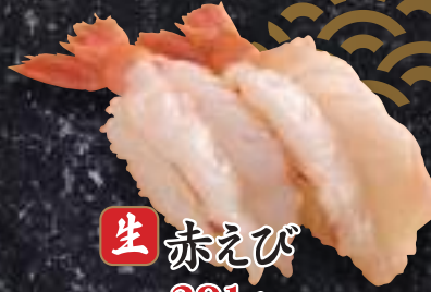
生赤えび 291円(税込320円)