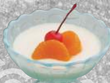
杏仁豆腐 237円(税込260円)