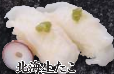
北海生たこ 482円(税込530円)