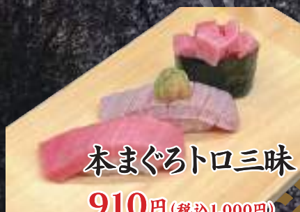
本まぐろトロ三味 910円(税込1,000円)