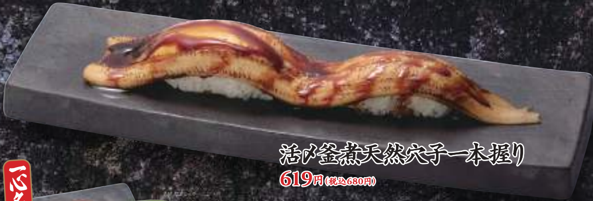
活〆釜煮天然穴子一本握り 619円(税込680円)

創業からお客様に愛されて20年。漁獲、開き、煮込みまでを1日で仕上げ、丁寧に一尾ずつ手作業でヌメリ取りを行うので、ふっくらした食感と穴子の風味が断然に違います。また頭、骨からダシをベースにした特製ダレで煮込むので旨味が強い自慢の逸品です。