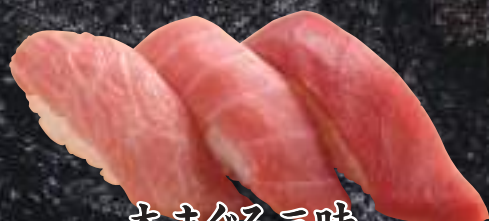
本まぐろ三味 1,364円(税込1,500円)