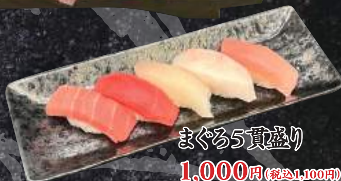
まぐろ5貫盛り 1,000円(税込1,100円)