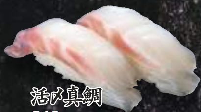
活け真鯛 310円(税込340円)