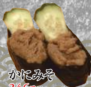
かにみそ 346円(税込380円)