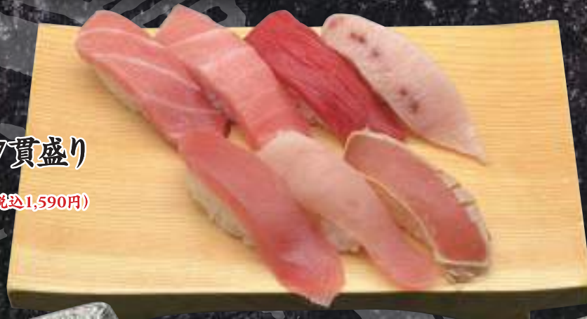
まぐろ7色7貫盛り 1,446円(税込1,590円)

これだけの種類の鮪を提供している回転寿司はめったにありません。 特にこだわりぬいている本まぐろは、200kg~300kgの魚体しか 使わないので脂の乗りが抜群。また船上で締めているので鮮度抜群です。 是非ぜ、味の違いを食べ比べてみてください。