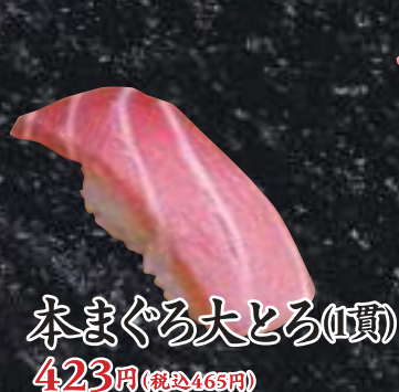
本まぐろ大とろ(1貫) 423円(税込465円)