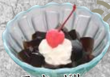
コーヒーゼリー 150円(税込165円)