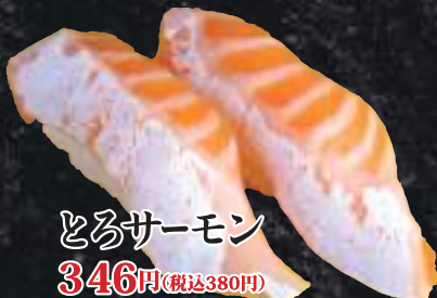
とろサーモン 346円(税込380円)