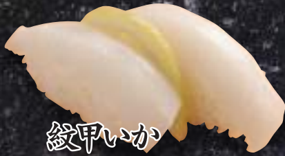
蛸甲いか 255円(税込280円)