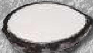
ココナッツアイス 419円(税込460円)