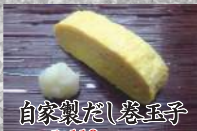
自家製だし巻玉子