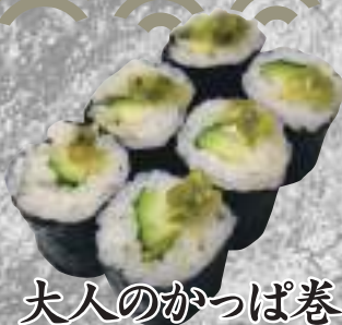
大人のかっぱ巻 164円(税込180円)