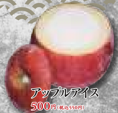
アップルアイス 500円(税込550円)