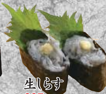
生しらす 237円(税込260円)