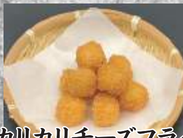
カリカリチーズフライ