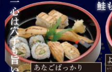
あなごぼっかり 本膳大とろ・本膳中とろ・本膳赤身・めかじとろ・ びんとろ・漬けまぐろ・きはだ鮪 2,280円(税込)