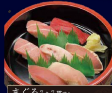
まぐろ7貫盛り 本膳大とろ・本膳中とろ・本膳赤身・めかじとろ・ びんとろ・漬けまぐろ・きはだ鮪 1,490円(税込)

※天候など船の状況により、欠品やネタの変更をお断りする 場合があります。 ※写真はイメージです。ご提供は船中にてお座りとなります。 ※お席のご予約は別途お申し込みください。 ※メニュー価格は、予告なく変更する場合がございます。