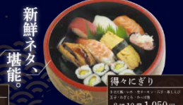
得々にごり 本膳大とろ・本膳中とろ・本膳赤身・めかじとろ・ びんとろ・漬けまぐろ 8種 10貫 1,050円(税込)