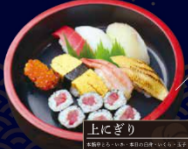
上にぎり 本膳大とろ・本膳中とろ・本膳赤身・めかじとろ・ びんとろ・漬けまぐろ 8種 10貫 1,580円(税込)