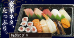
特選にごり 本膳大とろ・本膳中とろ・本膳赤身・めかじとろ・ びんとろ・漬けまぐろ・きはだ鮪 11種 13貫 2,280円(税込)