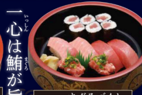
まぐろづくし 本膳中とろ・きはだまぐろ・わざとろ・ねぎとろ・漬れ巻き 1,480円(税込)