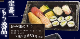
お子様にごり 本膳大とろ・本膳中とろ・本膳赤身・めかじとろ・ びんとろ・漬けまぐろ 7種 9貫 650円(税込)