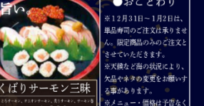
よくばりサーモン三昧 いしほ・ろけとろ・本膳大とろ・本膳中とろ・本膳赤身・ めかじとろ・びんとろ・漬けまぐろ・きはだ鮪 1,380円(税込)

●おこたわり ※12月31日～1月2日は、 単品寿司のご注文は承りませ ん。限定商品のみのご注文と させていただきます。 ※天候など船の状況により、 欠品やネタの変更をお断りす る場合があります。 ※メニュー・価格は予告なく 変更する場合がございます。