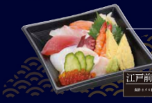
江戸前ちらし 本膳大とろ・本膳中とろ・本膳赤身・めかじとろ・ びんとろ・漬けまぐろ・きはだ鮪 1,280円(税込)