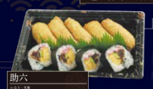
助六 本膳大とろ・本膳中とろ・本膳赤身・めかじとろ・ びんとろ・漬けまぐろ 2種 9貫 550円(税込)